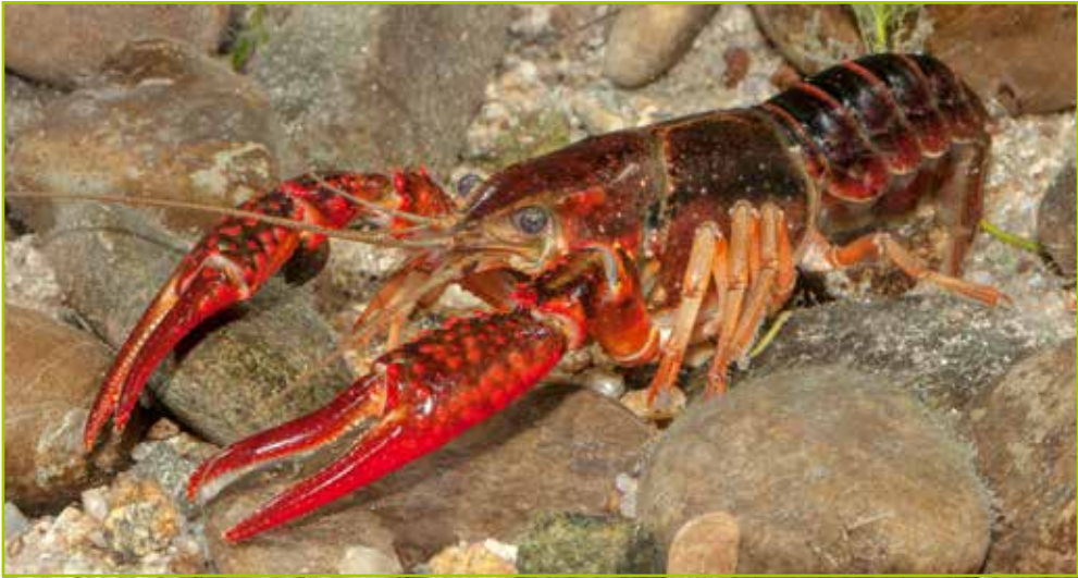
Abb. 2: Roter Amerikanischer Sumpfkrebs.